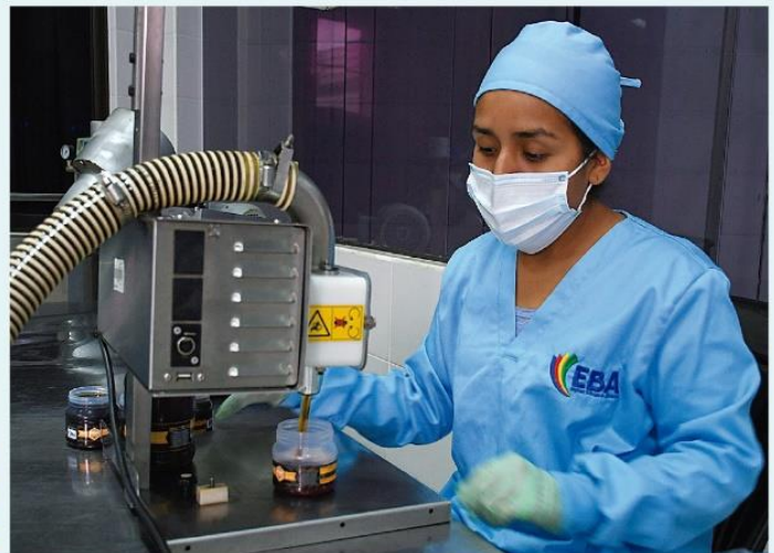
Envasado de la miel