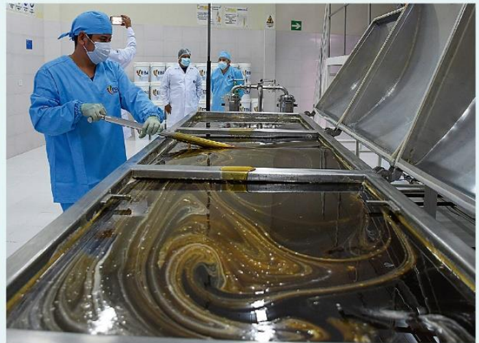
Proceso de mezclado de la miel