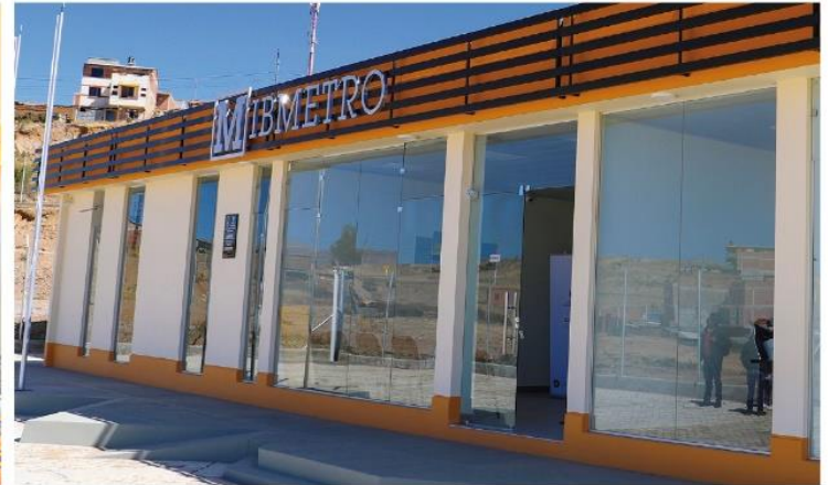
Oficinas y laboratorios de Ibmetro en Sucre

El 24 de mayo, el presidente Luis Arce inauguró las nuevas oficinas y laboratorios del Instituto Boliviano de Metrología (Ibmetro) en el municipio de Sucre, para fortalecer al sector productivo a fin de garantizar productos de calidad.