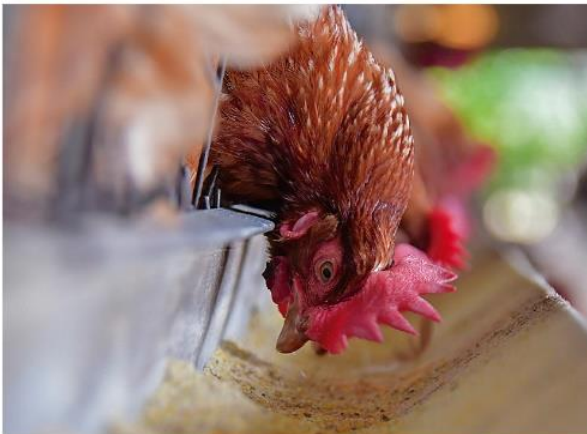
Maíz alimenta a las granjas avícolas del país