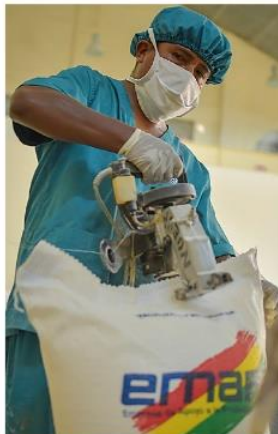
Producción de harina