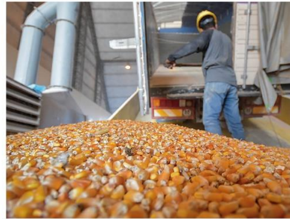
Acopio de maíz