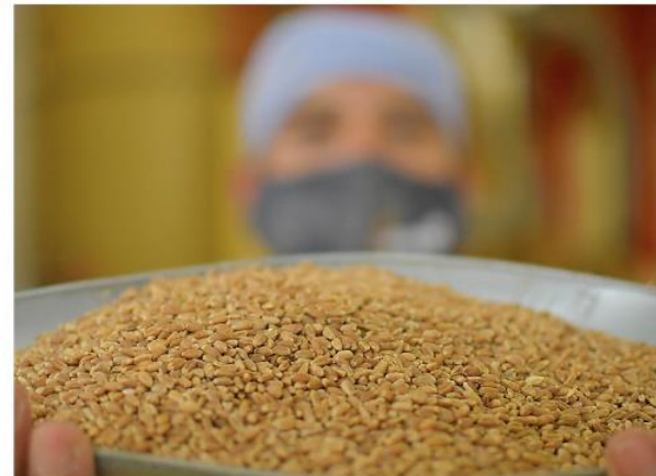
Acopio de trigo en el país