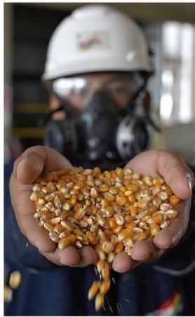
Producción de maíz