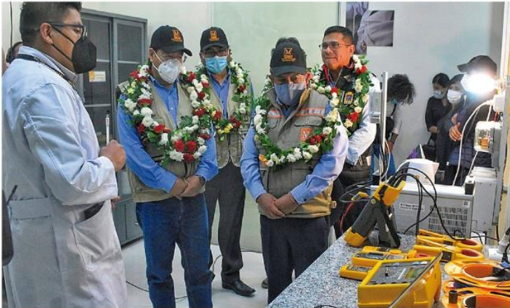
Ch'alla de las nuevas instalaciones de Ibmetro en Lajastambo, Sucre