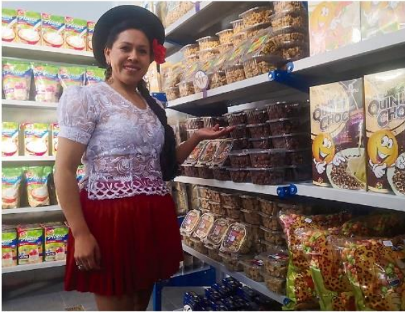
Inauguración supermercado Emapa en Sucre

Además, Emapa brindó apoyo a productores de maíz con la venta a precio justo de más de 1.000 kilogramos de semilla y 1.000 litros de agroquímicos para 889 hectáreas de maíz por un valor de Bs 709.000, para la producción de 3.271 toneladas de ese grano, en beneficio de los municipios de Monteagudo y Villa Vaca Guzmán.