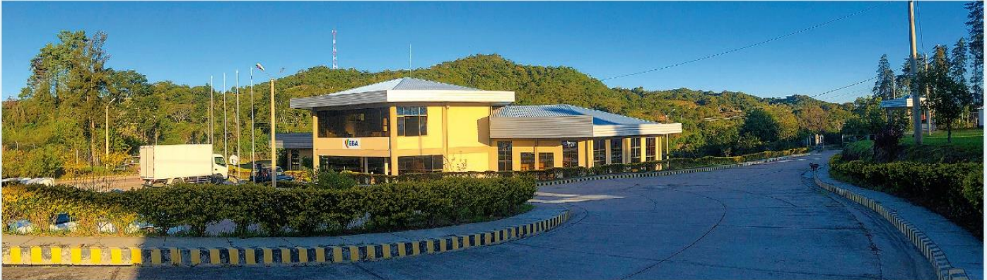
Centro de Innovación Productiva (CIP)

tos de miel de EBA son comercializados a través de los subsidios Prenatal y Lactancia y el Universal en los departamentos de Santa Cruz, Tarija, Chuquisaca y Potosí, que alcanzaron ingresos durante el año pasado por más de Bs 16,1 millones.