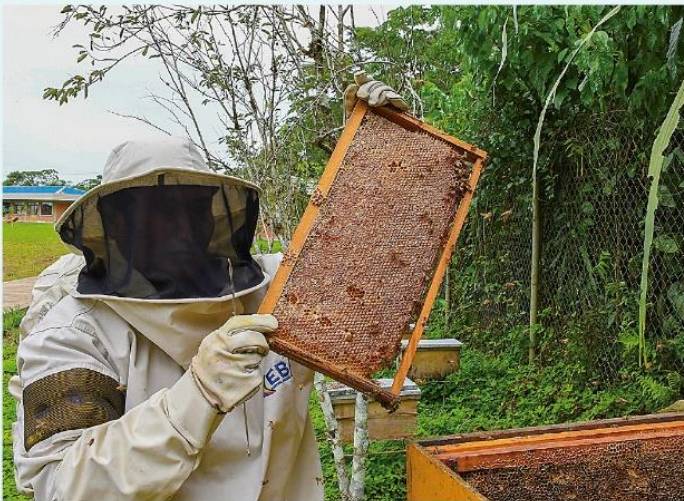
Acopio de miel