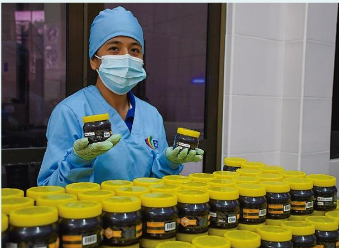
Productos listos para el consumo de la población