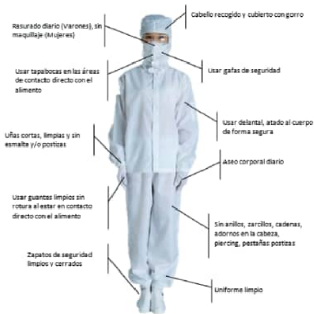
Buenas Prácticas de Manufactura (BPM)

Las Buenas Prácticas de Manufactura (BPM) en la producción artesanal de derivados del tomate son esencial para garantizar la inocuidad. Además, contribuyen a la eficiencia en la producción dentro de la agricultura familiar y al mantenimiento de la confianza del consumidor, garantizando un producto apto para consumir.